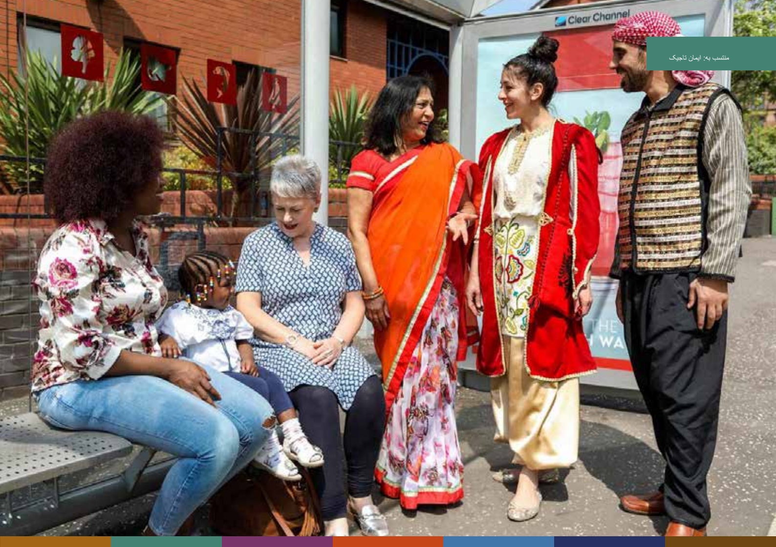
منسوب به: ایمان تاجیک