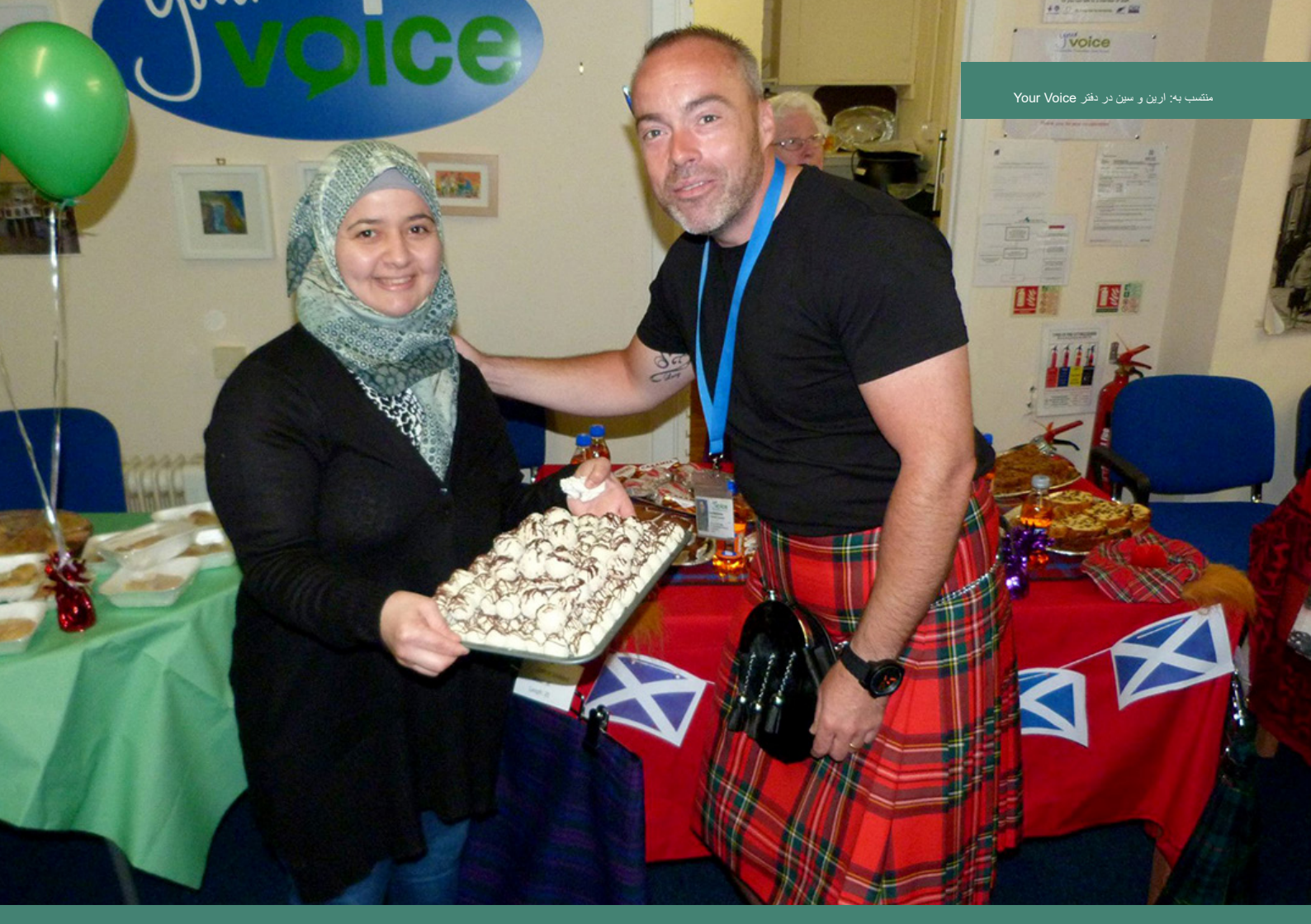
منتخب به: ارین و سین در دفتر Your Voice